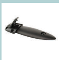
Fixations pour jonction de bureaux