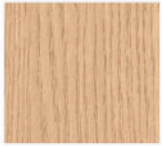
D1 - Chêne blanchi