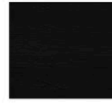
N61 - Frêne verni noir