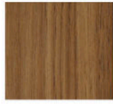
RR - Noyer