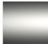
H - Chrome