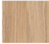
D2 - Chêne ambré