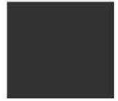
N1 - Gris foncé