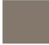
N2 - Gris cubanite