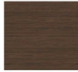
D4 - Noyer foncé