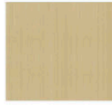
V1 - Frêne