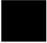
J4 - Noir