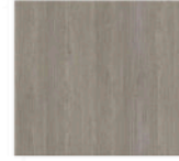
D5 - Gris bois