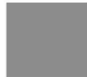
M - Métallique