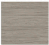
N63 - Noyer verni gris