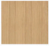
AA - Chêne